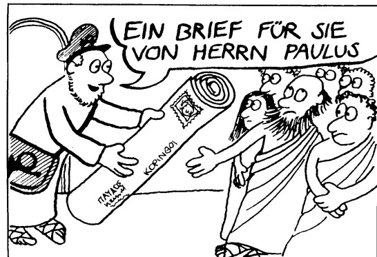
... entfaltete die Kirche schon bald einen regen Schriftverkehr, ...