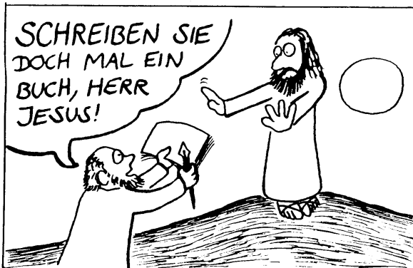
Im Gegensatz zu ihren Anfängen ...