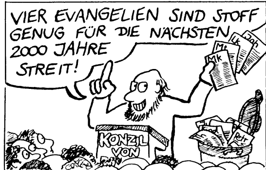
... Rationalisierungsmaßnahmen nötig wurden.