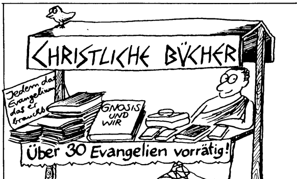
... so daß schon nach wenigen Jahrzehnten ...